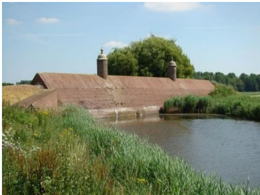
Stenen Poppen, Klundert

De blikvanger voor Klundert is de Stenen Poppen . Het is in de letterlijke zin een blikvanger: herkenbaar in het landschap, goed zichtbaar vanuit verschillende gezichtspunten, markant in zijn verschijningsvorm en fotogeniek. Voor de afvaardiging van Klundert kan de Stenen Poppen uitgroeien tot het visitekaartje van Klundert. Het moet dan uiteraard goed onderhouden zijn en bezoekers moeten de mogelijkheid hebben het werk op zijn voordeligst te kunnen benaderen, bekijken en fotograferen. Dit sluit naadloos aan op de huidige beweging dat beeld allesoverheersend is: als er geen goede foto mogelijk is, verliest een plek veel waarde.