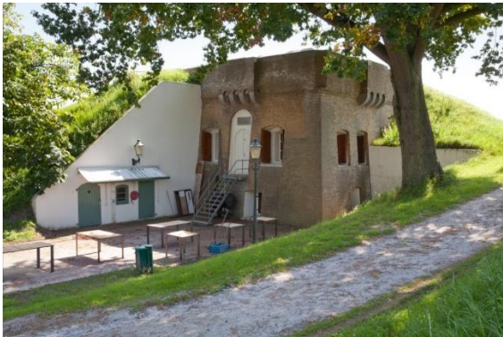
Fort De Hel

Onder de categorie 'interessant – een bezoek waard' vallen eigenlijk alle overige onderdelen van de verdedigingswerken. Als afzonderlijke plek of gebouw zijn ze meestal niet onderscheidend of aantrekkelijk genoeg om bezoekers van ver te verleiden naar Willemstad of Klundert te komen. Als een bezoeker eenmaal ter plekke is, zal deze echter ongetwijfeld een paar van deze plekken en gebouwen bekijken. Zijn de blikvangers en parels de etalage van beide plaatsen, deze andere plekken zijn de 'koopwaar' als de bezoeker eenmaal binnen is. Voor bewoners zijn het vanzelfsprekende plekken en objecten in de eigen omgeving waarvoor ze in de regel grote waardering hebben en die voor hen ook recreatieve waarde hebben.