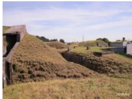
Bunkers WO II, Bastion Gelderland