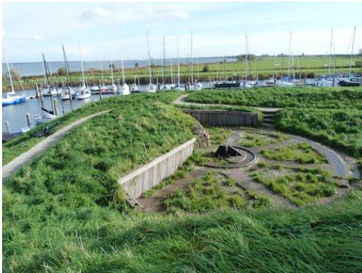
Bastion Groningen, Willemstad

Tegenover het bastion is nu echter de nieuwe cruiseterminal gepland. Bezoekers die met deze schepen aankomen worden langs het bastion de vesting in geleid. Dit biedt een uitgelezen mogelijkheid om van het bastion – in combinatie met de binnenhaven waar het vlak achter ligt – een poort tot Willemstad te maken. Het moet dan opgeknapt, beter toegankelijk en vooral meer beleefbaar gemaakt worden. Een bezoek aan bastion Groningen maakt dan direct het verhaal van de vesting Willemstad duidelijk. Feitelijk wordt bastion Groningen dan samen met de binnenhaven de blikvanger van Willemstad.