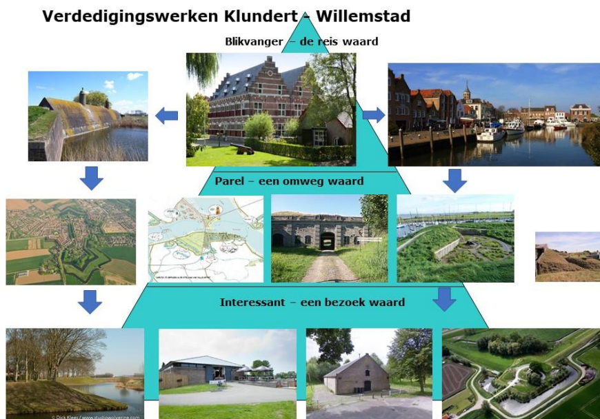
Interessante plekken Klundert en Willemstad