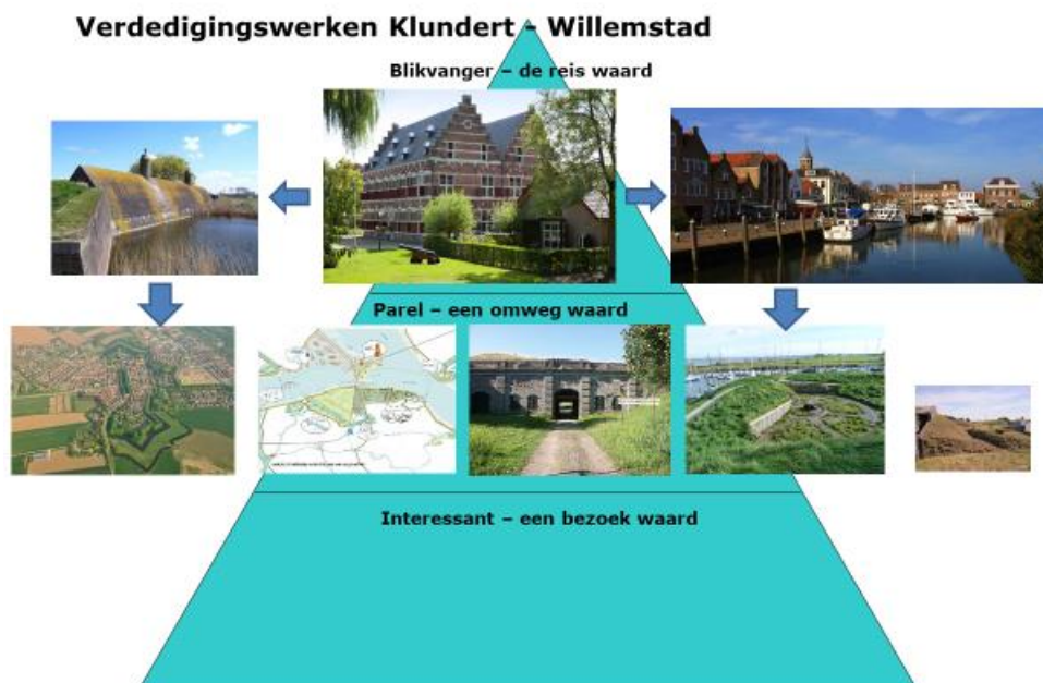
Parels Klundert en Willemstad

De kracht van de verdedigingswerken binnen de gemeente Moerdijk is dat het bezoekers een compleet meerdaags programma kan bieden. Daartoe dienen de verschillende onderdelen beter met elkaar verbonden en gepromoot te worden. Een aantrekkelijke manier om dit te realiseren is een beleevingsroute langs alle vestingwerken in de gemeente. Een route gemaakt met de nieuwste technieken en media zodat bewoners bijvoorbeeld virtueel een inundatie of belegering kunnen ervaren. Het ontwikkelen van een dergelijke route vormt bovendien onderdeel van het programma Zuiderwaterlinie waar de gemeente aan deelneemt.