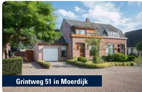
Grintweg 51 in Moerdijk

De Moerdijkregeling is één van de maatregelen om het dorp Moerdijk weer nieuwe glans te geven en maakt het voor huidige én toekomstige inwoners aantrekkelijk om een huis in het dorp Moerdijk te kopen. Er wordt daarnaast een keur aan investeringen in en rond het dorp gedaan om de leefbaarheid te verbeteren. Werkzaamheden zijn in volle gang en de hernieuwde glans tekent zich af in enthousiasme en initiatieven.