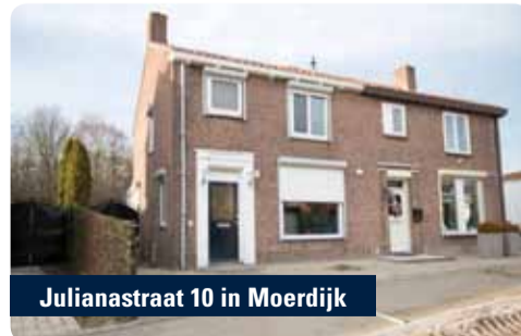
Julianastraat 10 in Moerdijk

Twee-onder-één-kapwoning met aanbouw, carport