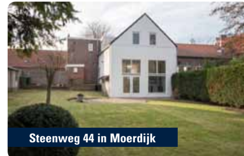
Steenweg 44 in Moerdijk

Op de verdieping bevinden zich 4 slaapkamers en de badkamer. Ruime achtertuin met schuur, gelegen op het noordoosten. De ruimte en rust zelf ervaren? Maak vrijblijvend een afspraak voor een rondleiding met Q Makelaars via www.qmakelaars.nl .