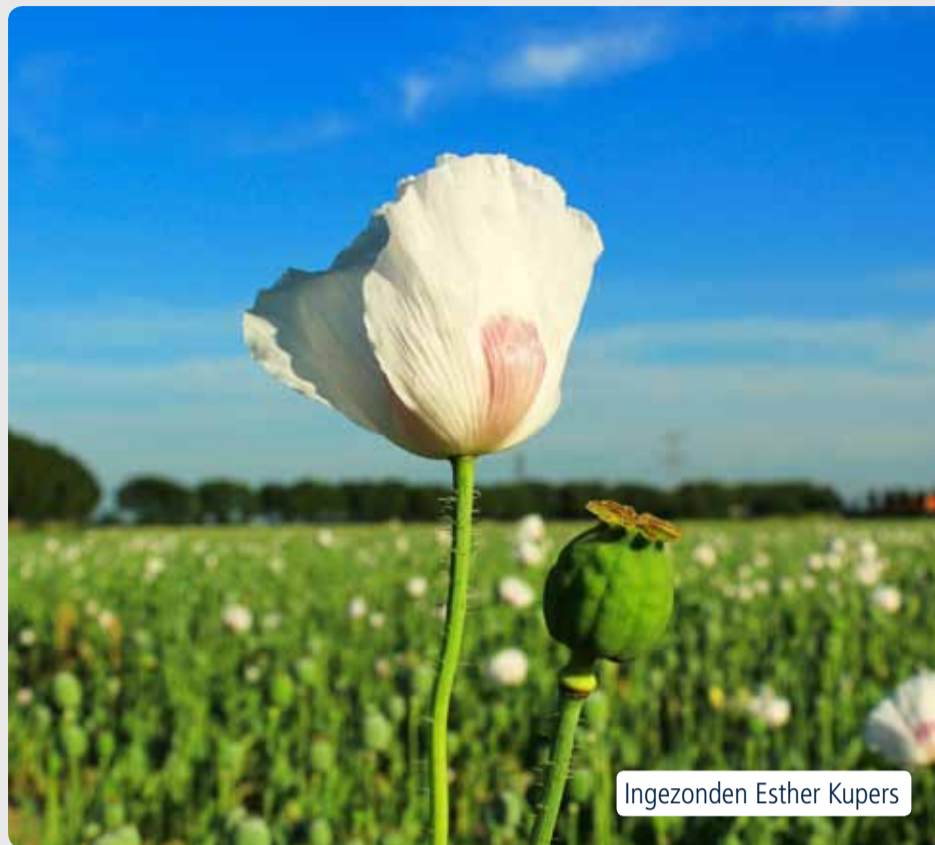
Ingezonden Esther Kupers

Deze trotse papaver staat op een veld roze papavers net buiten Noordhoek.