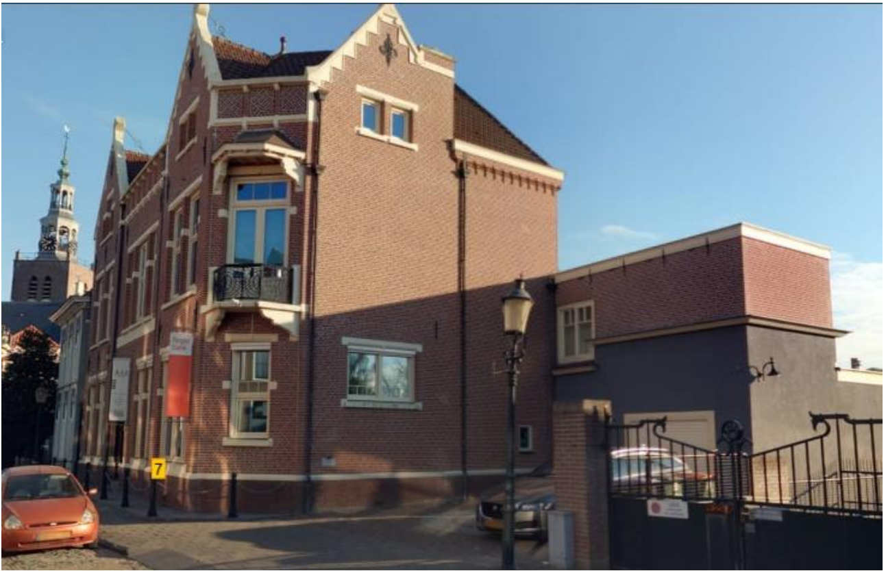
Rechterzijgevel

Voormalig postkantoor, Stationsstraat 7 Zevenbergen