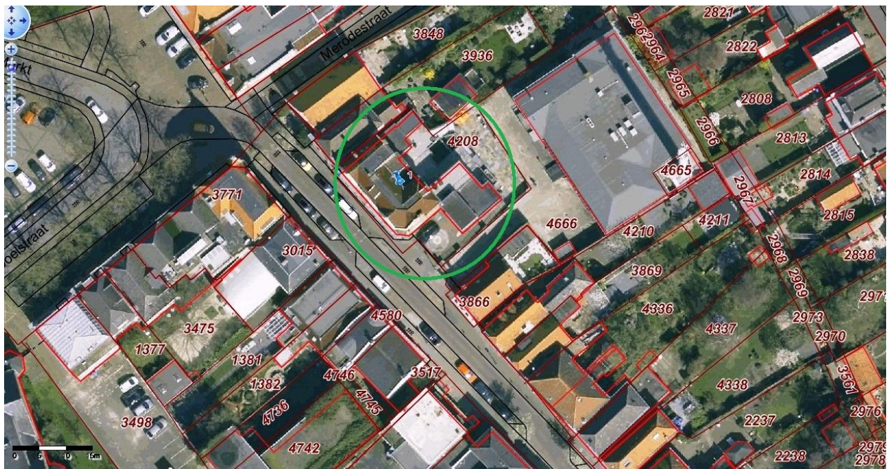
Voormalig postkantoor, Stationsstraat 7 Zevenbergen