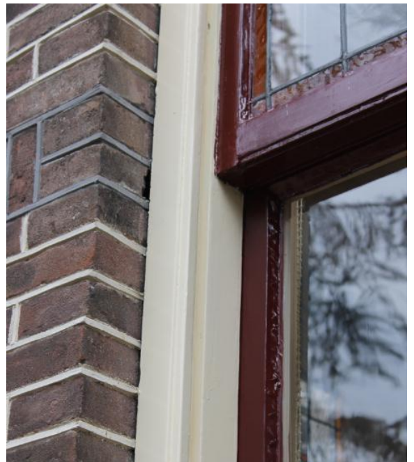
Detail voegwerk en venster