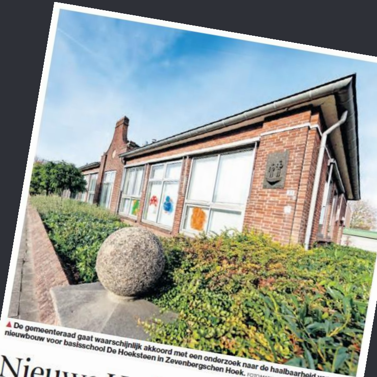
▲ De gemeenteraad gaat waarschijnlijk akkoord met een onderzoek naar de haalbaarheid van nieuwbouw voor basisschool De Hoeksteen in Zevenbergschen Hoek.

Aanleiding en doel Betrokken partijen Stand van zaken