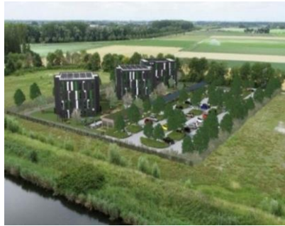
3 woontorens project Schansdijk, door Kafra Housing

De voorbereidingen voor de bouw van tijdelijke huisvesting aan de Schansdijk 12 is vanaf half oktober gestart. Het begint met grondwerkzaamheden, hierna start het heien en het verder geschikt maken van het terrein. Ook komen er parkeerplaatsen en een ontsluitingsweg. De oplevering van de woontorens staat gepland voor eind december/januari.