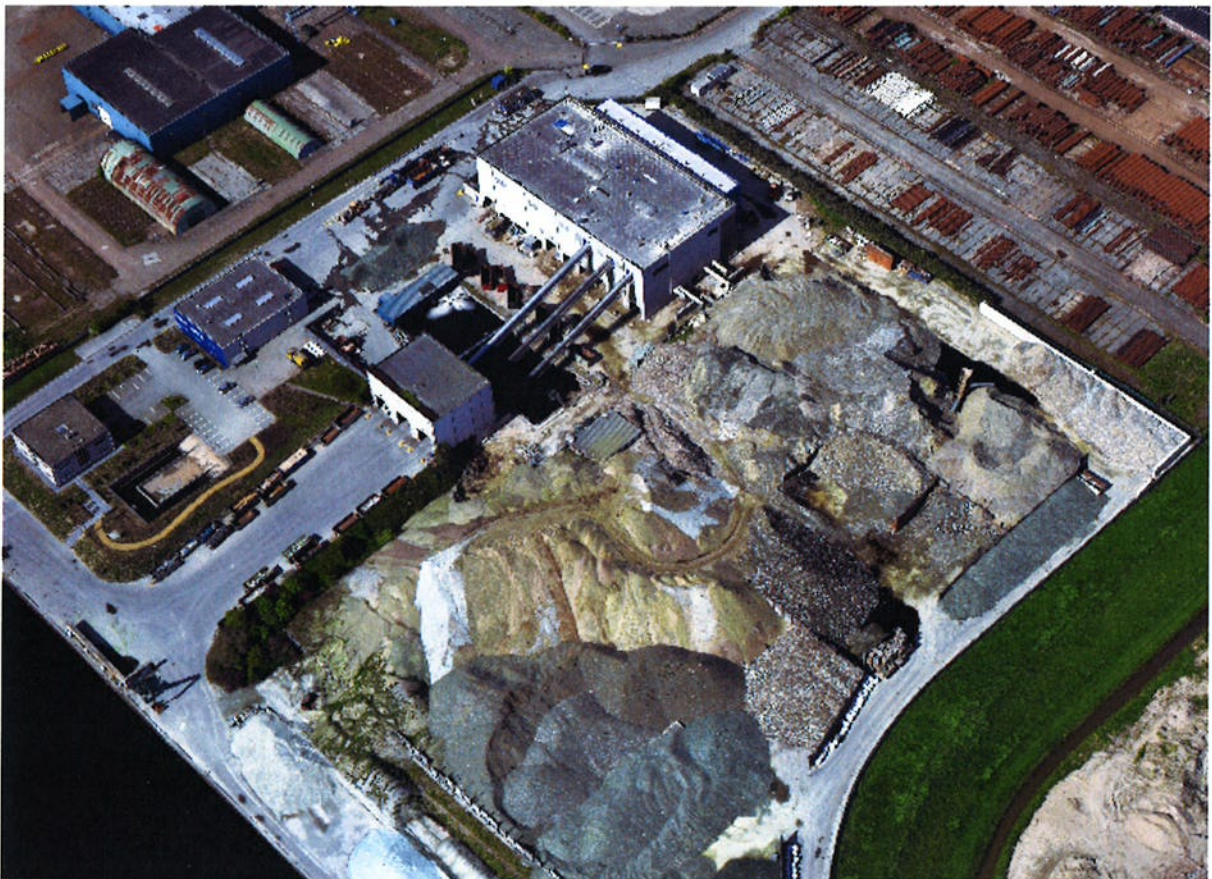
Figuur 1: Luchtfoto april 2017