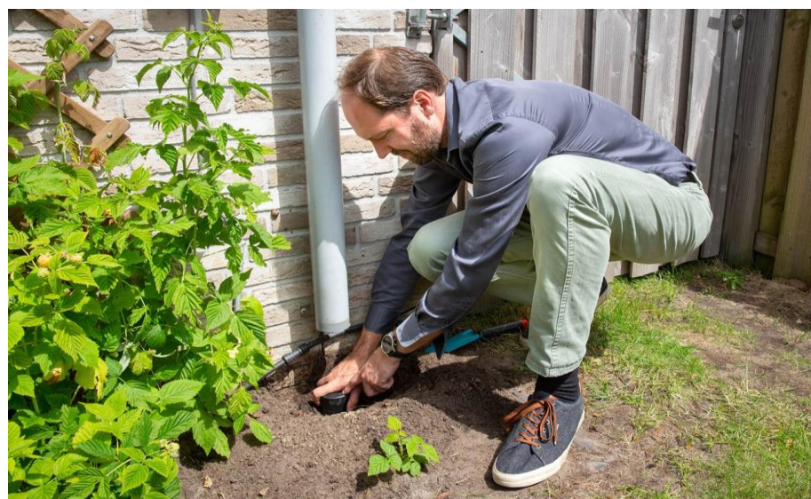
De bestaande regenbuis sluiten wij af.