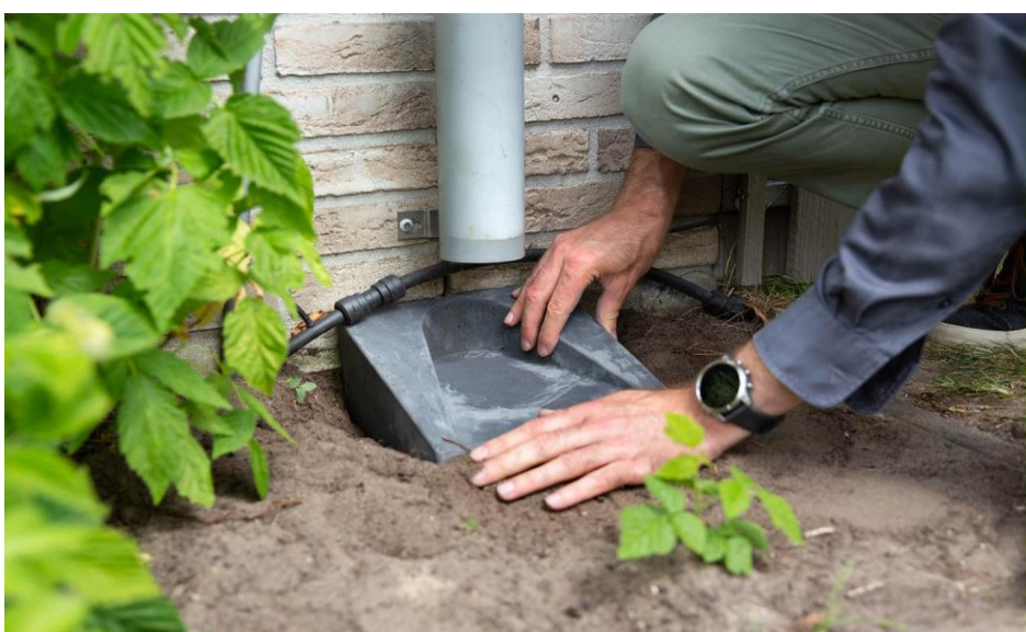
De afkoppelsteen wordt geplaatst.