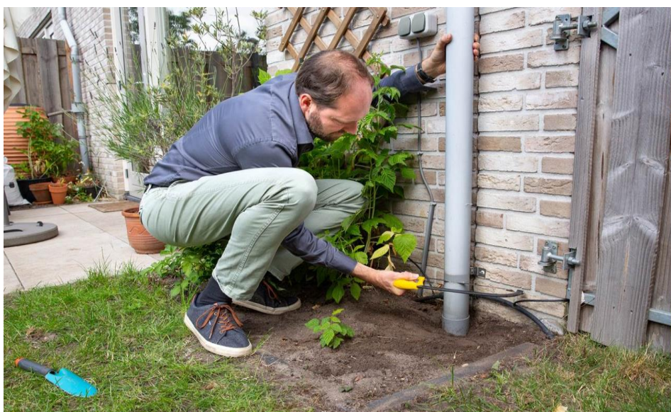
De regenbuis zagen wij door.

Samen werken we aan een betere leefomgeving!