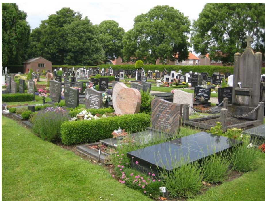
foto1: begraafplaats Zevenbergen raakt vol op korte termijn

In de bijlagen (als los document bijgevoegd) zijn de volledige onderzoeksrapporten opgenomen, tabellen met sterftcijfers voor Klundert en Zevenbergen en referentiebeelden van begraafplaatsen.