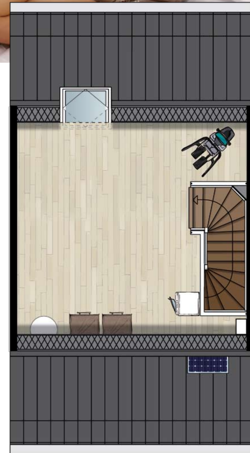
2 e VERDIEPING