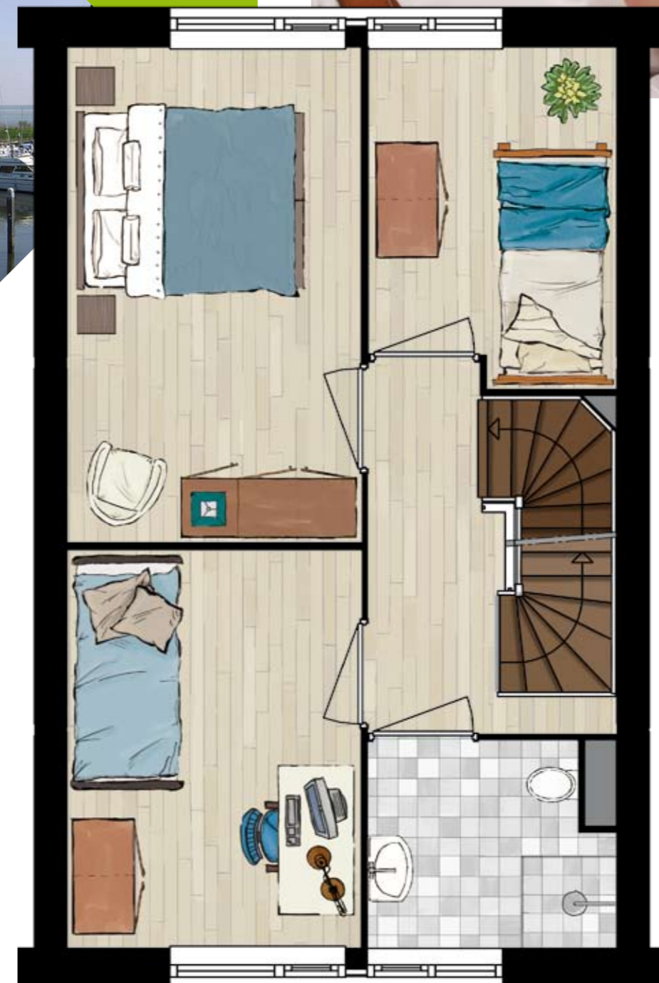
1 e VERDIEPING