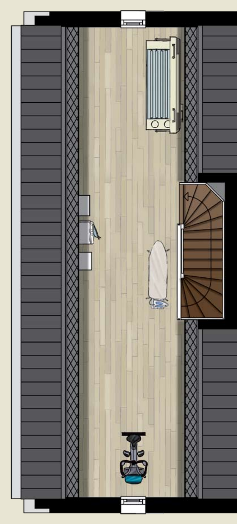
2 E VERDIEPING