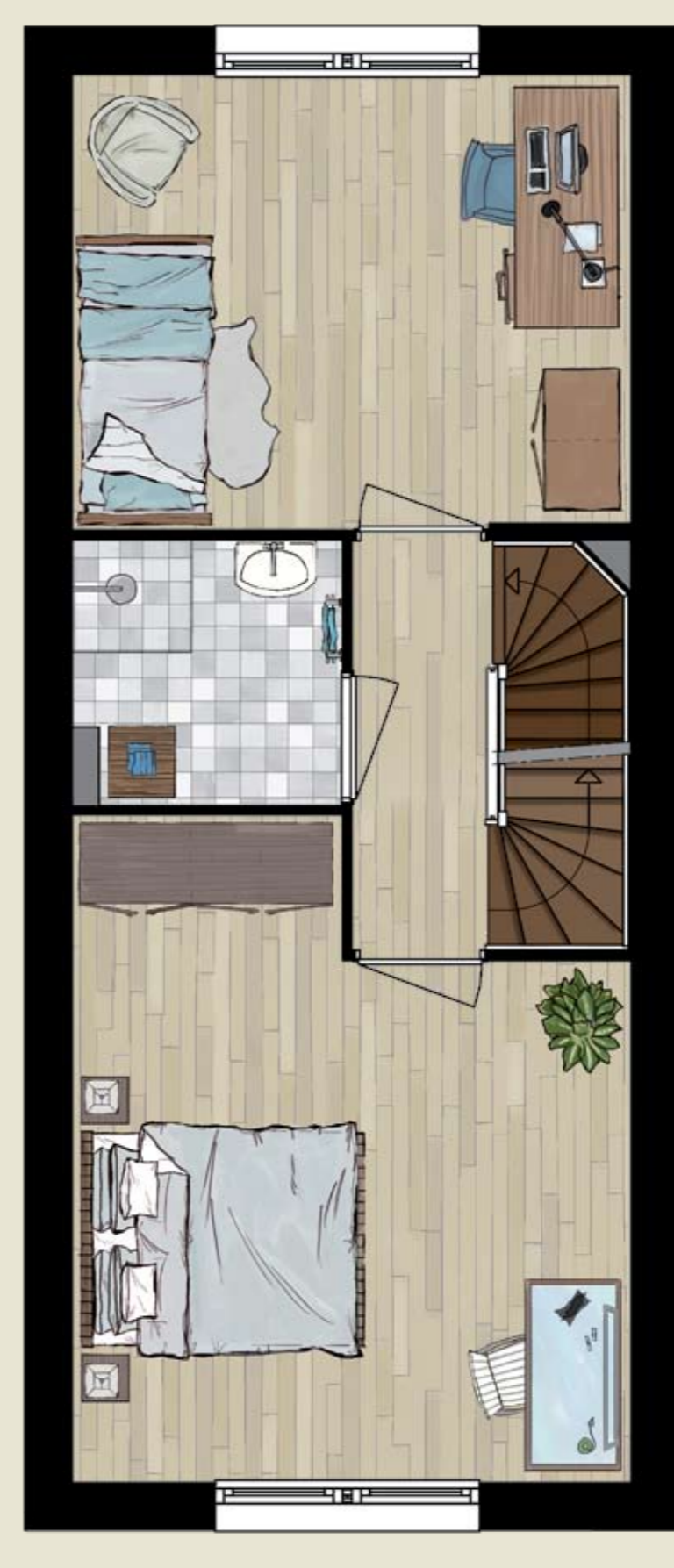
1 E VERDIEPING